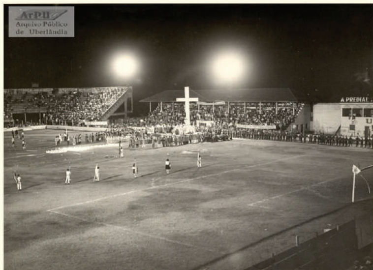
Missa campal dedicada a Nossa Sra Aparecida no Estádio Juca Ribeiro.