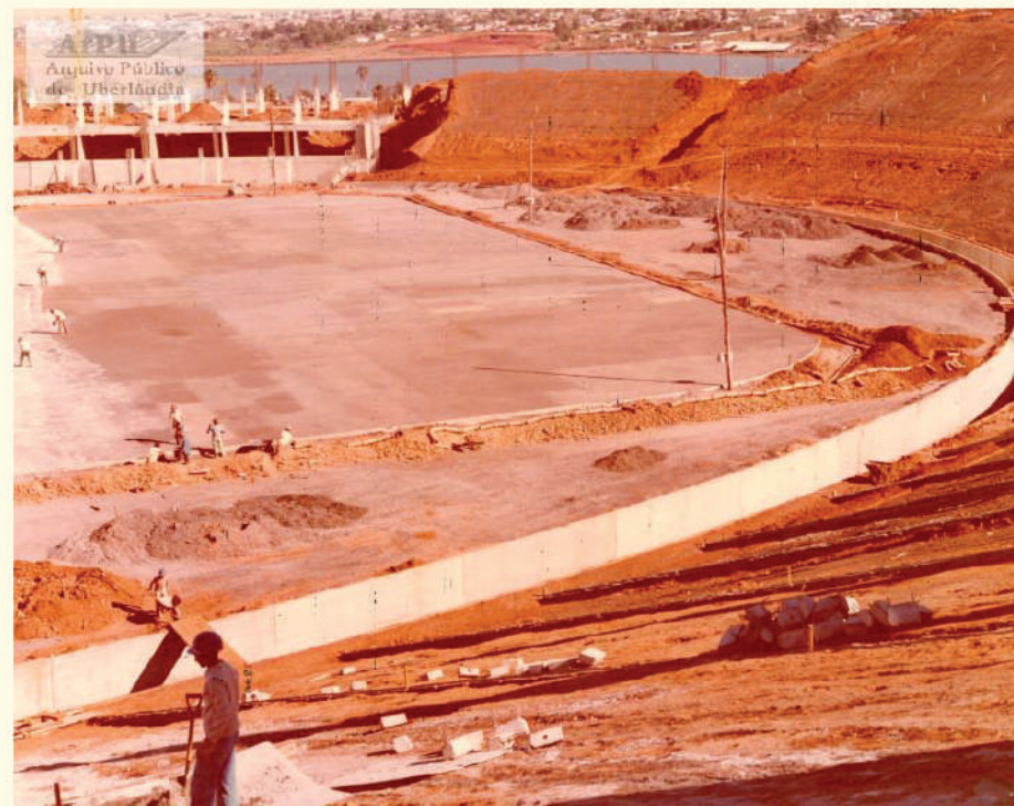
Construção do Estádio João Havelange (Parque do Sabiá). Inaugurado em 1982.