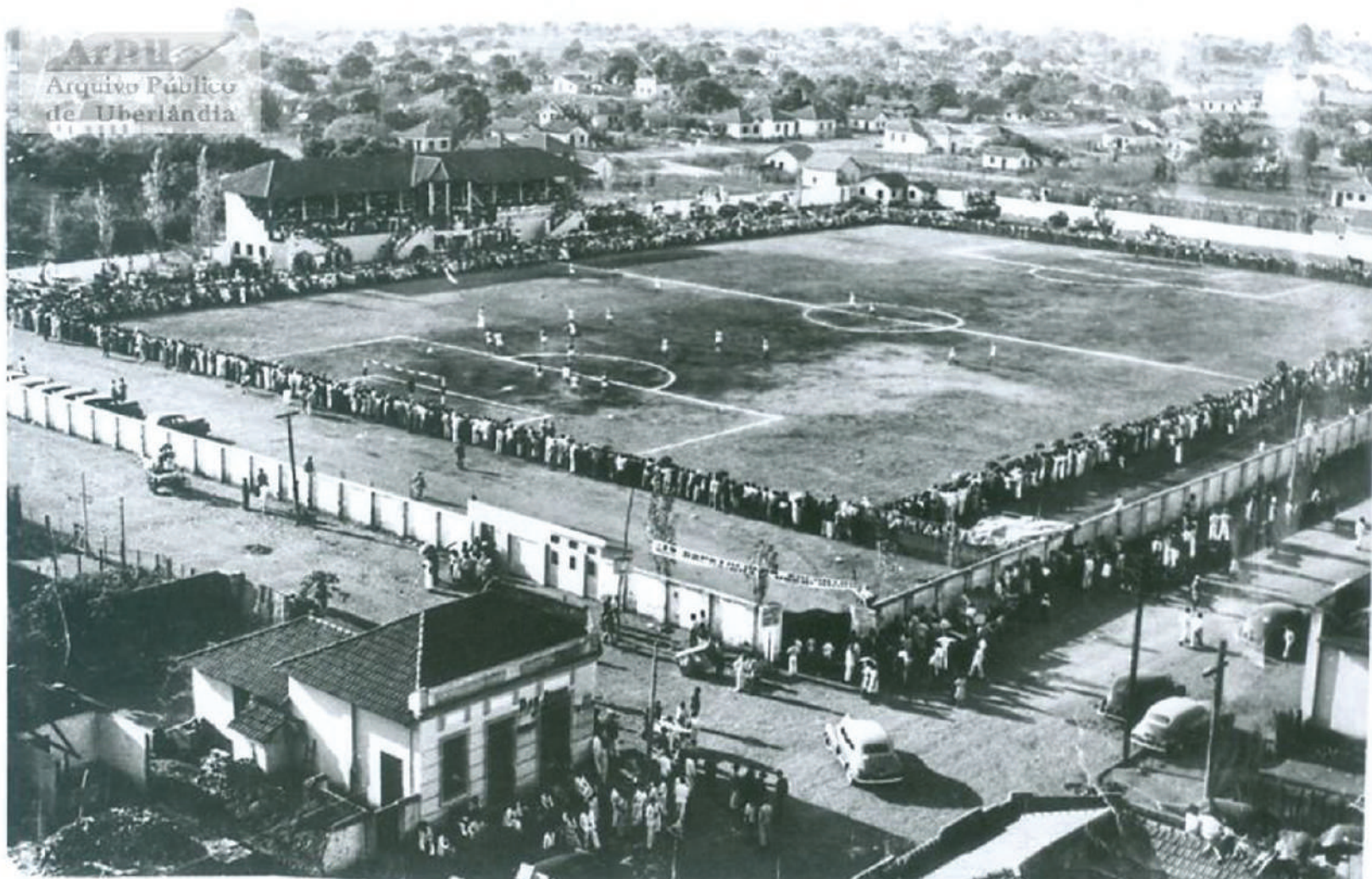
Partida de futebol no estádio Juca Ribeiro. Década de 1930..