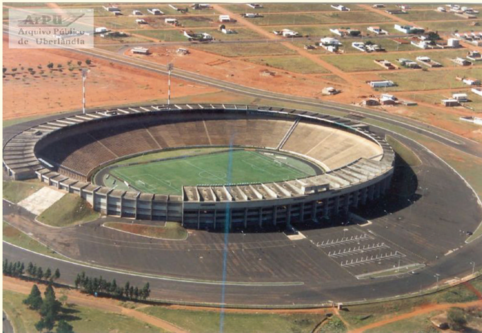
Estádio Municipal João Havelange. Complexo Parque do Sabiá - Jan. 1991.