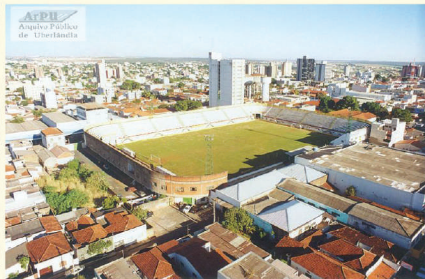
Estádio Juca Ribeiro. Demolido em 2013 e construído no local o Supermercado Bretas.