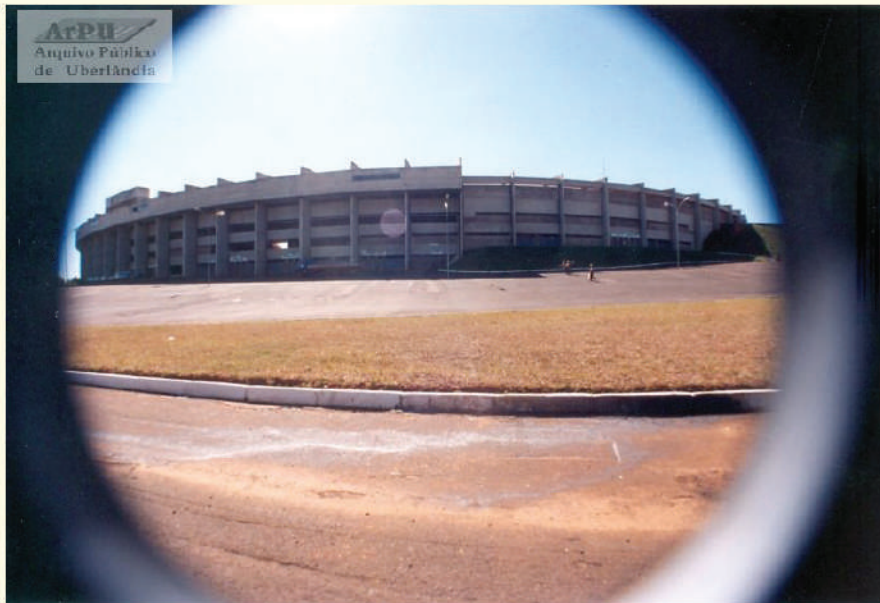
Estádio Municipal João Havelange. Complexo Parque do Sabiá.