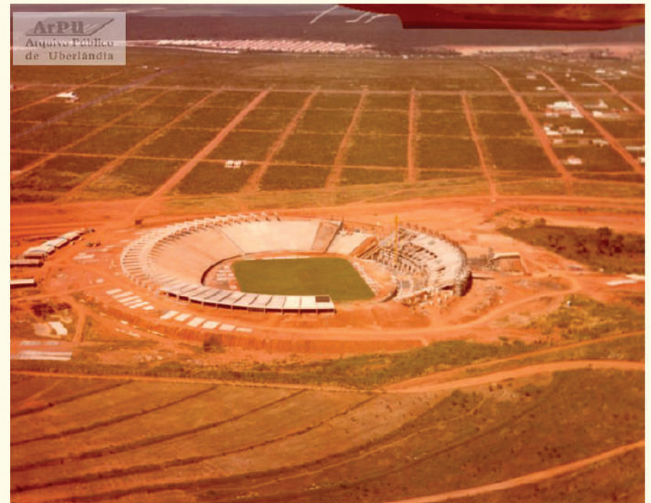
Construção do Estádio João Havelange (Parque do Sabiá). Início dos anos de 1980. No alto vista parcial dos bairros Santa Mônica e Segismundo Pereira