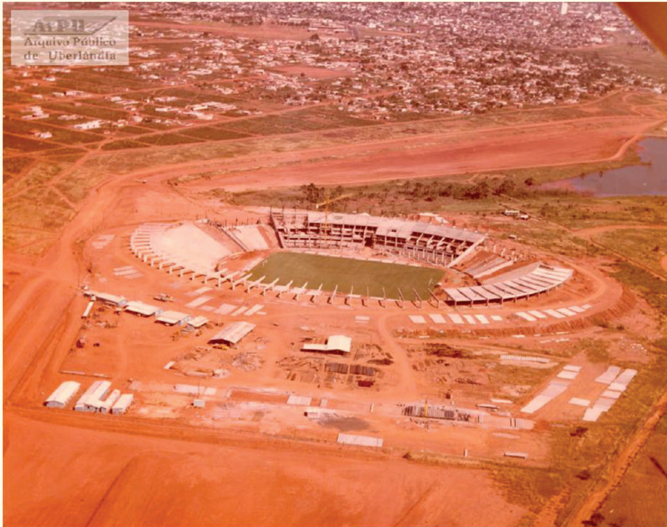
Construção do Estádio João Havelange (Parque do Sabiá). Década de 1980. Inaugurado em 1982. Vista parcial do bairro Santa Mônica.