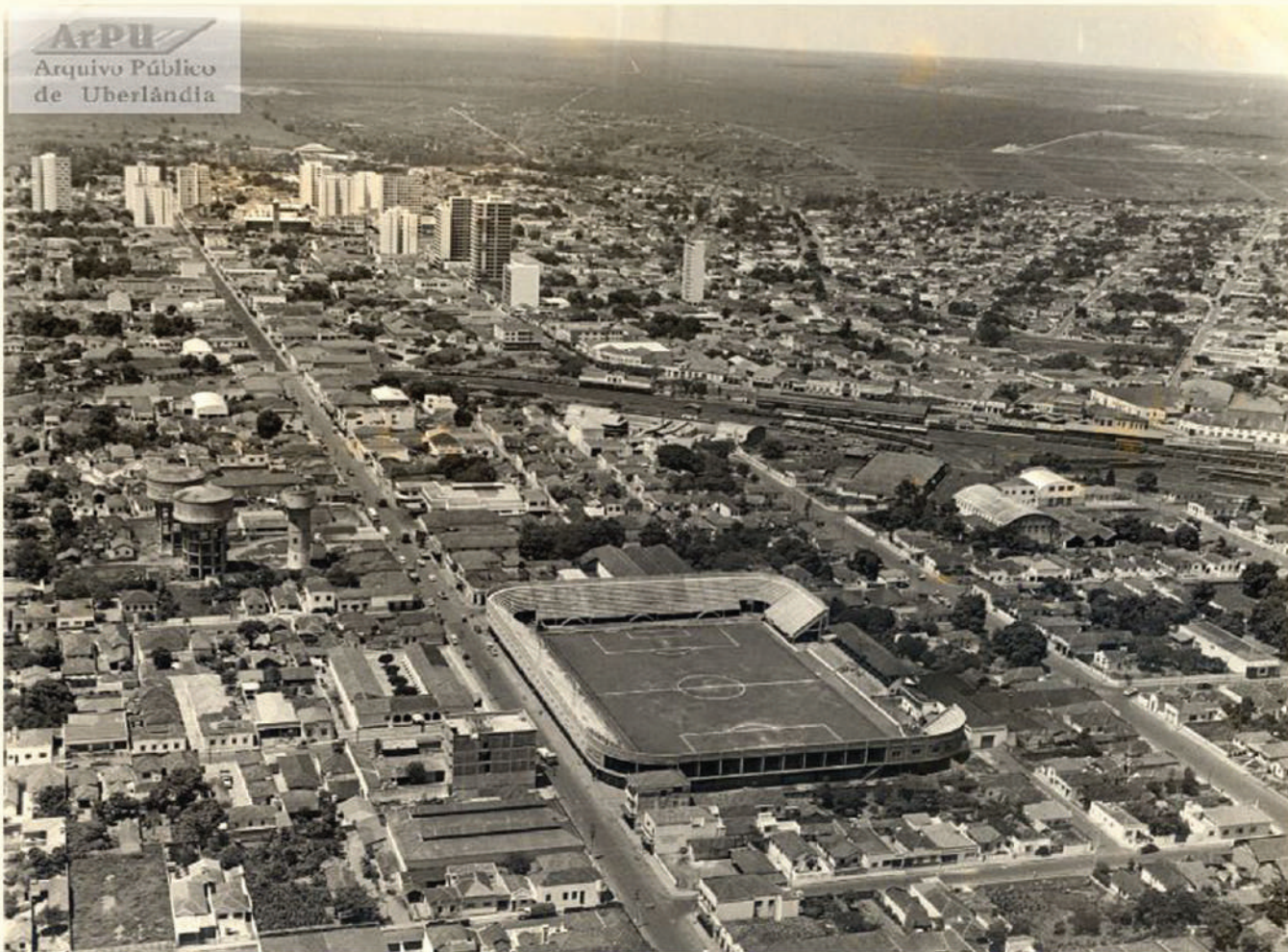
Vista parcial da cidade. Em 1º plano bairro Aparecida, o Estádio Juca Ribeiro e as caixas d'água. No centro Estação da Mogiana e em 2º plano a esquerda área central e à direita bairro Martins. Década de 1970.