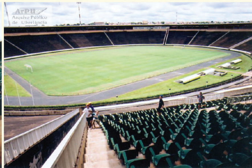
Interior do Estádio João Havelange atual parque do Sabiá em 08 de Janeiro de 2003.Nome alterado em junho de 2015.